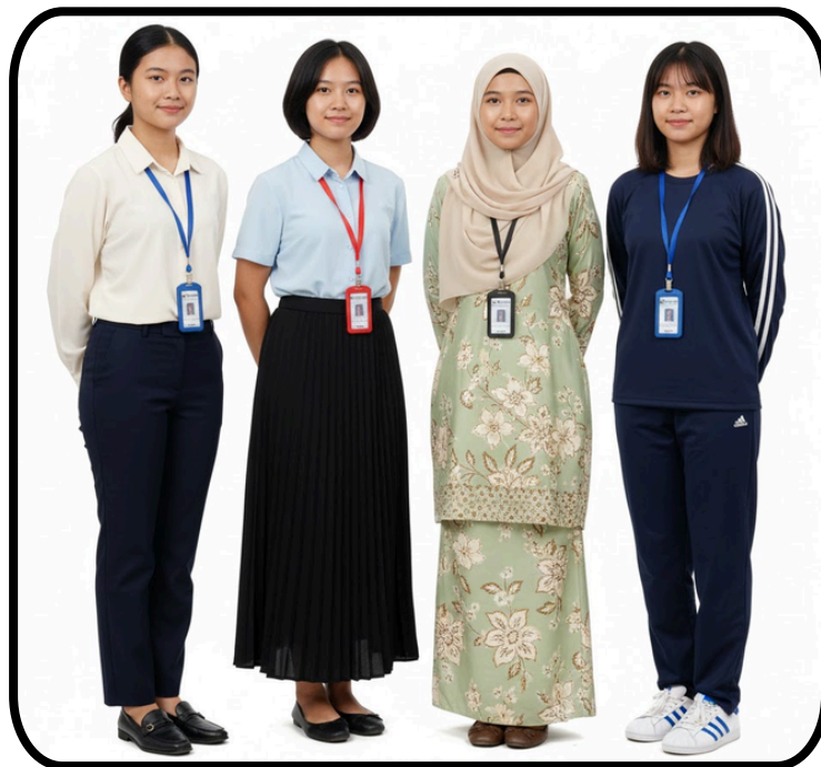
Gambar 3 : Penampilan Diri Pelajar Perempuan