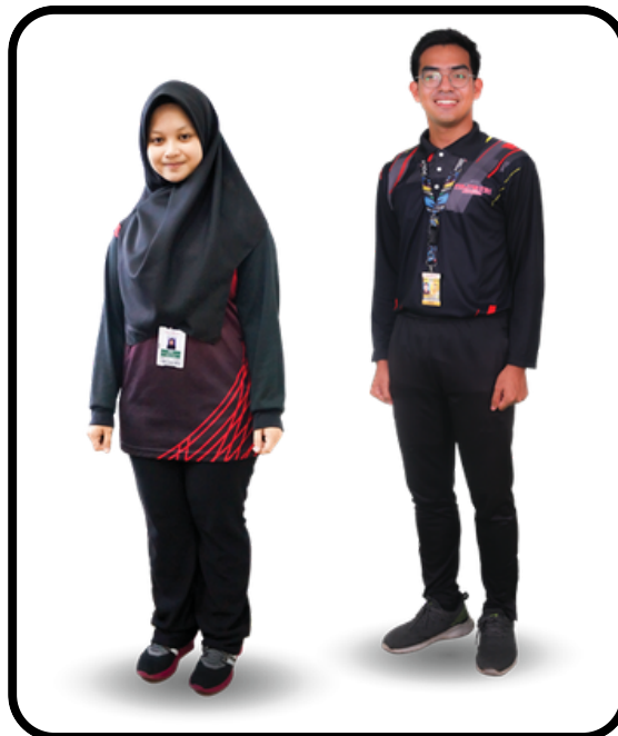
Gambar 4 : Penampilan Diri Semasa Riadah/Sukan

5.3.2 Semua pelajar Islam DIWAJIBKAN menutup aurat.