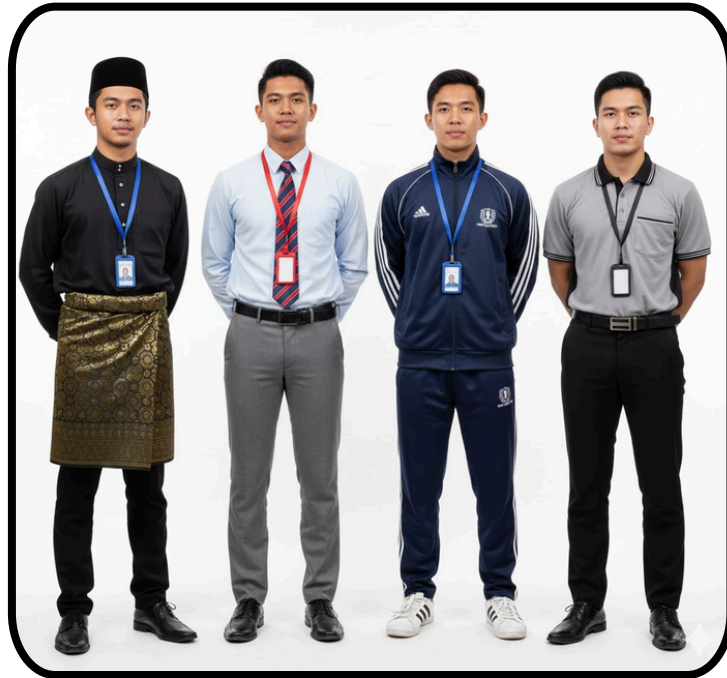
Gambar 1 : Penampilan Diri Pelajar Lelaki